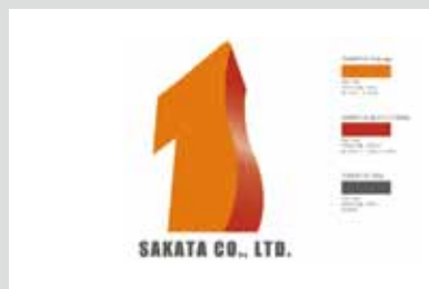
●株式会社サカタ C.I. アートディレクション/デザイン