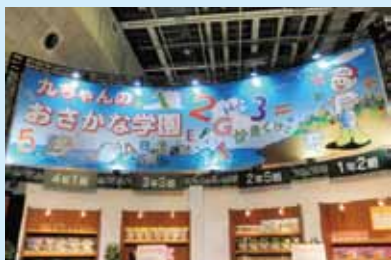
●フィッシングショー OSAKA 2010 制作/施工