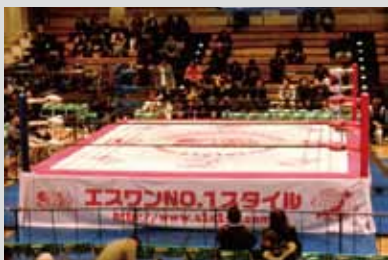
●エスワン プロレスリングマット 制作