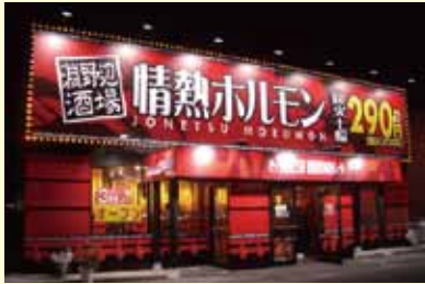
● 潮野辺酒場 情熱ホルモン 制作/施工