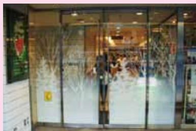
●ウイング高輪 2009 クリスマス 制作/施工