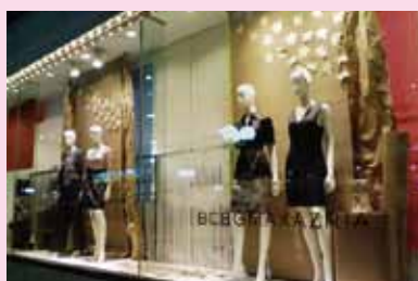
●BCBG MAXAZRIA 日比谷シャングレ店 施工