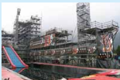
●DOORS 2006 (TB5) 制作/施工