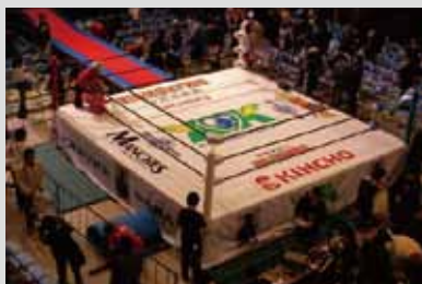
●健介オフィス プロレスリングマット 制作