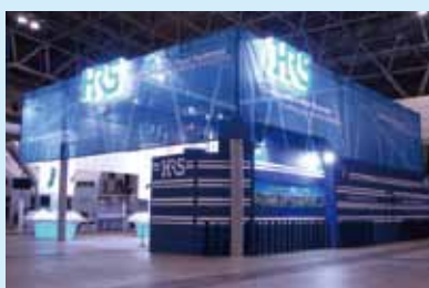
●ヒロセ電機ブース 制作/施工