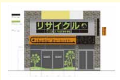
● 総合リサイクルプラザ Studio Re:birth デザイン/制作/施工