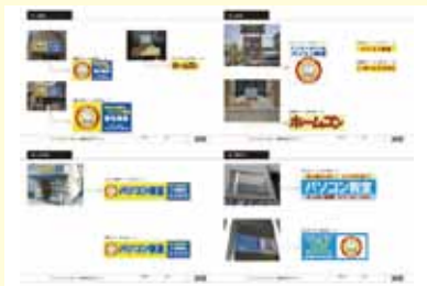
● ホームコンじゅく 各教室サイン変更 デザイン/制作/施工