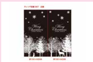
●ウイング高輪 2010 クリスマス デザイン/制作/施工