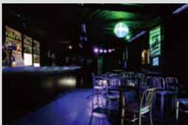
●The Gallery Roppongi 内装 デザイン/設計/施工