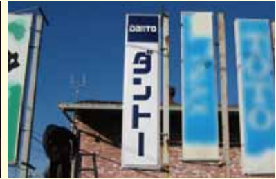
● ダントー看板 ホウクス平塚店 制作/施工