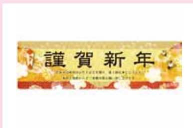
●ウイング上大岡 2011 正月 デザイン/制作/施工