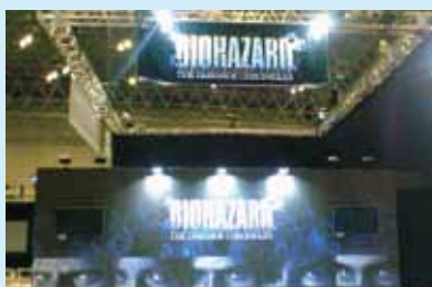
●東京ゲームショウ 2009 制作/施工