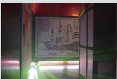
●六本木 NewLex 内装 デザイン/設計/施工