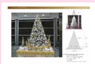
●アレア品川 2008 クリスマス デザイン/制作/施工