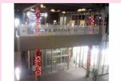
●アレア品川 2009 クリスマス デザイン/制作/施工