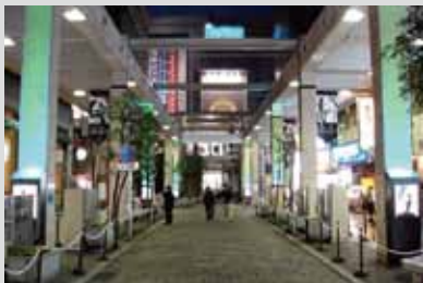
●相模大野地区コリドー等グレードアップ事業 制作・施工