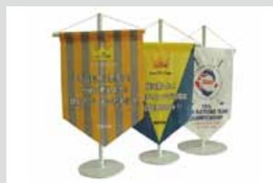
●卓上フラッグ 制作