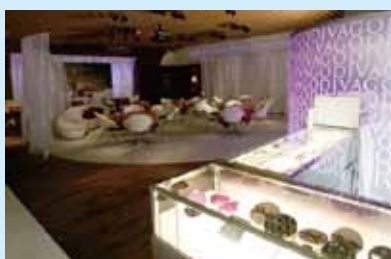
●GODIVA カフェ 制作/施工