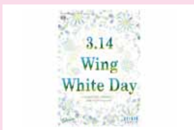
●ウイング高輪 2008 ホワイトデー デザイン/制作/施工