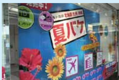
●夏バケ キャンペーン 制作/施工