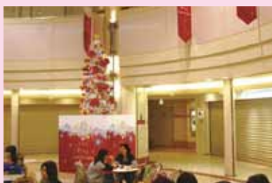
●ウイング上大岡 2009 クリスマス デザイン/制作/施工