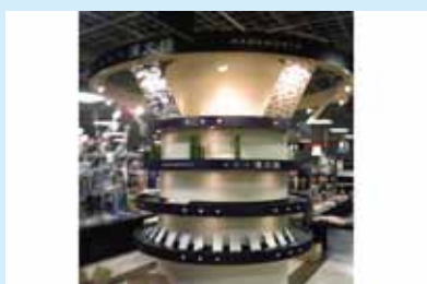
●演文様 書店内特設ブース 制作/施工