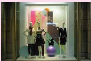
●BCBG MAXAZRIA 恵比寿三越店 施工