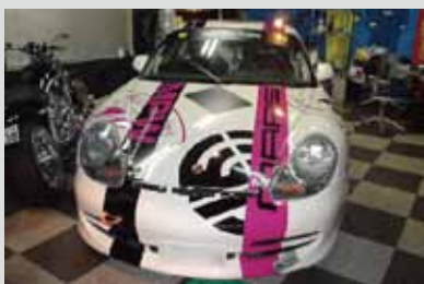
●カーラッピング 制作/施工