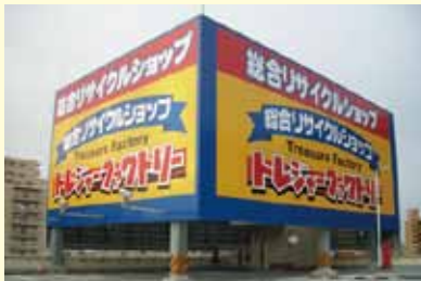
● トレジャーファクトリー 幕張店 制作/施工