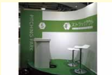
● マッスルパーク 各種サイン 制作/施工