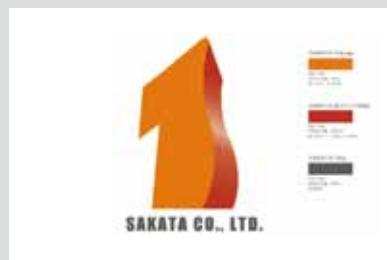
●株式会社サカタ C.I. アートディレクション/デザイン